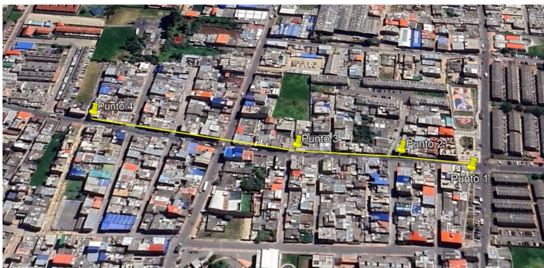
Ilustración 1. Recorrido

Se realizó recorrido de control y vigilancia en el cuadrante 2, barrio Serrezuelita el día 27 de junio del 2024, desde las coordenadas 4°42'24.408" N - 74°12'30.392" W hasta las coordenadas 4°42'34.640" N - 74°12'35.344" W (ver ilustración 1. Ruta amarilla), con el fin de verificar las condiciones ambientales, identificar posibles afectaciones a los recursos naturales y realizar las acciones de prevención correspondientes.